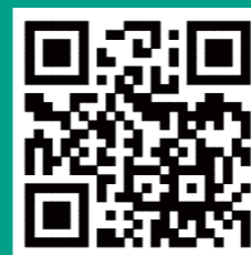
全国学生资助 管理中心网站