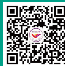
“中国学生资助” 微信服务号

本简介内容及相关文件可登录全国学生资助管理中心网站 ( http://www.xszz.cee.edu.cn )和“中国学生资助”微信服务号查阅